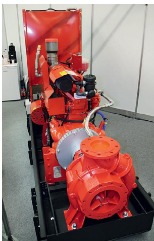
Kompakte Lösung: Die Winter Pumpen GmbH präsentierte eine hochleistungsfähige Sprinklerpumpe auf einer eigens dafür gefertigten Grundplatte mit Schaltschrank. Der Pumpenspezialist für Löschwassersysteme bietet individuelle Lösungen an.