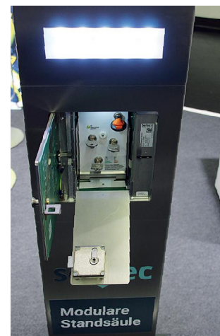
Schlüsseldepot: Setec Sicherheitstechnik aus Seefeld (BY) stellte u. a. eine modulare Standardsäule vor. Die VdS-zugelassene Modulsäule aus 3 mm geschliffenem V2A-Edelstahl ist beleuchtet und für die Aufbewahrung von bis zu vier Schlüsseln geeignet.