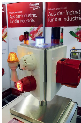
Aus der Industrie für die Industrie: Die Compro Electronic GmbH aus Vechta zeigte LED-Signalsäulen, LED-Signalleuchten und elektronische Kleinhupen in Verbindung mit LED-Signalleuchten für nahezu alle Verwendungs- und Einsatzzwecke.